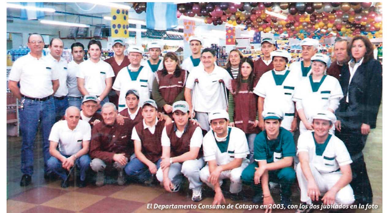
El Departamento Consumo de Cotagro en 2003, con los dos jubilados en la foto