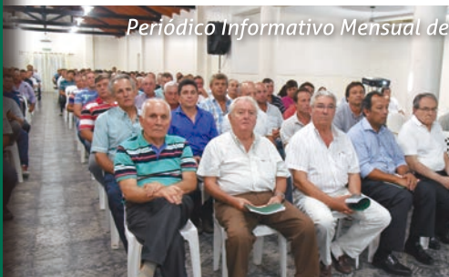
Periódico Informativo Mensual de COTAGRO Cooperativa Agropecuaria Limitada