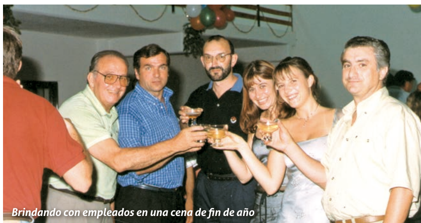
Brindando con empleados en una cena de fin de año