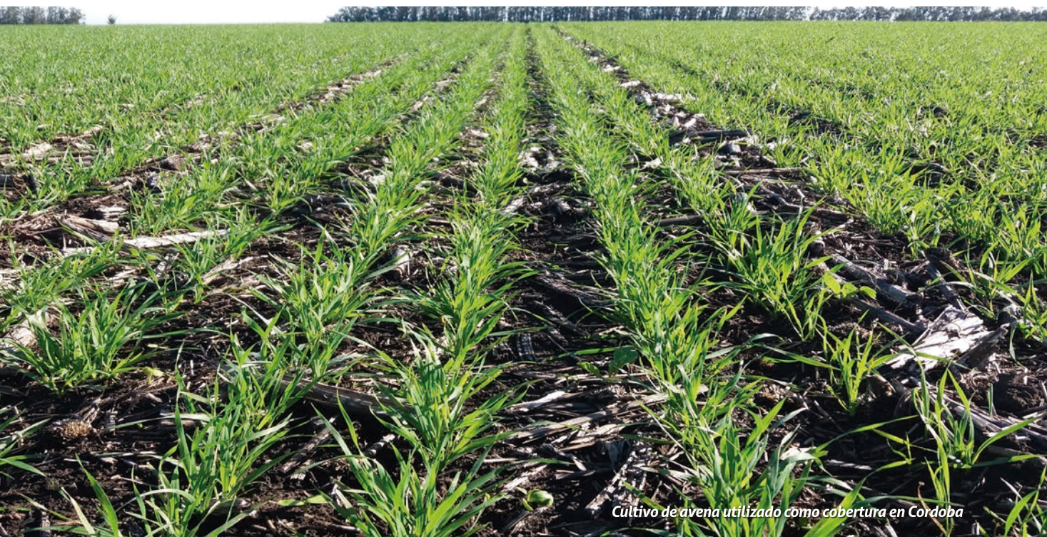
Cultivo de avena utilizado como cobertura en Córdoba