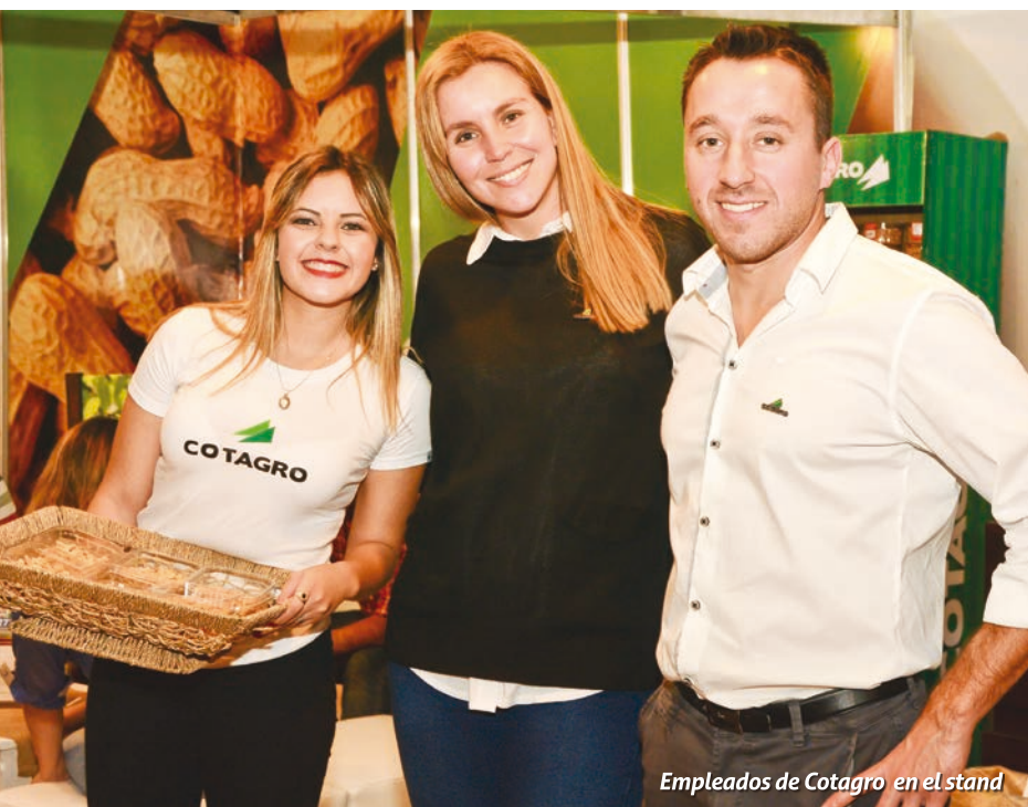
Empleados de Cotagro en el stand

La tercera edición de Sabores del Maní pasó por General Cabrera y como todos los años, Cotagro participó con un stand propio del festival gastronómico en honor a nuestro producto regional.