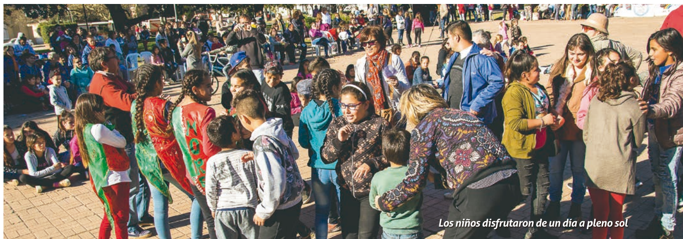
Los niños disfrutaron de un día a pleno sol