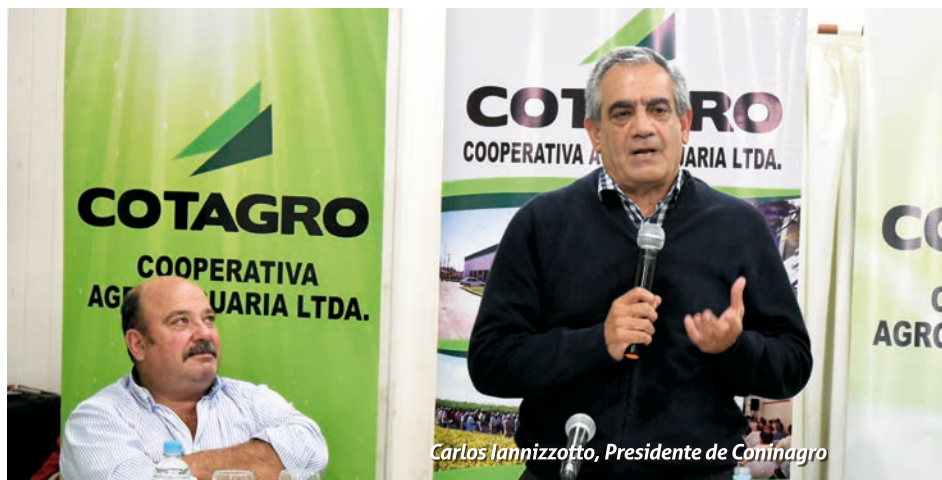
Carlos Iannizzotto, Presidente de Coninagro