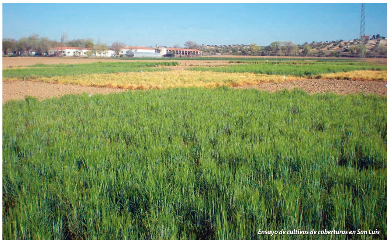
Ensayo de cultivos de coberturas en San Luis