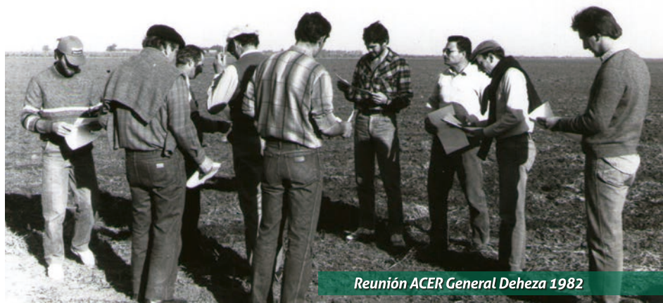
Reunión ACER General Deheza 1982

La familia de Cotagro felicita a General Deheza y Las Perdices por estos 50 y 25 años de trabajo y servicio ininterrumpidos, agradece a los asociados por la confianza y el apoyo permanente y a todos quienes en este medio siglo destinaron parte de su tiempo a representar a estos centros en el Consejo de Administración y la Comisión Asesora.