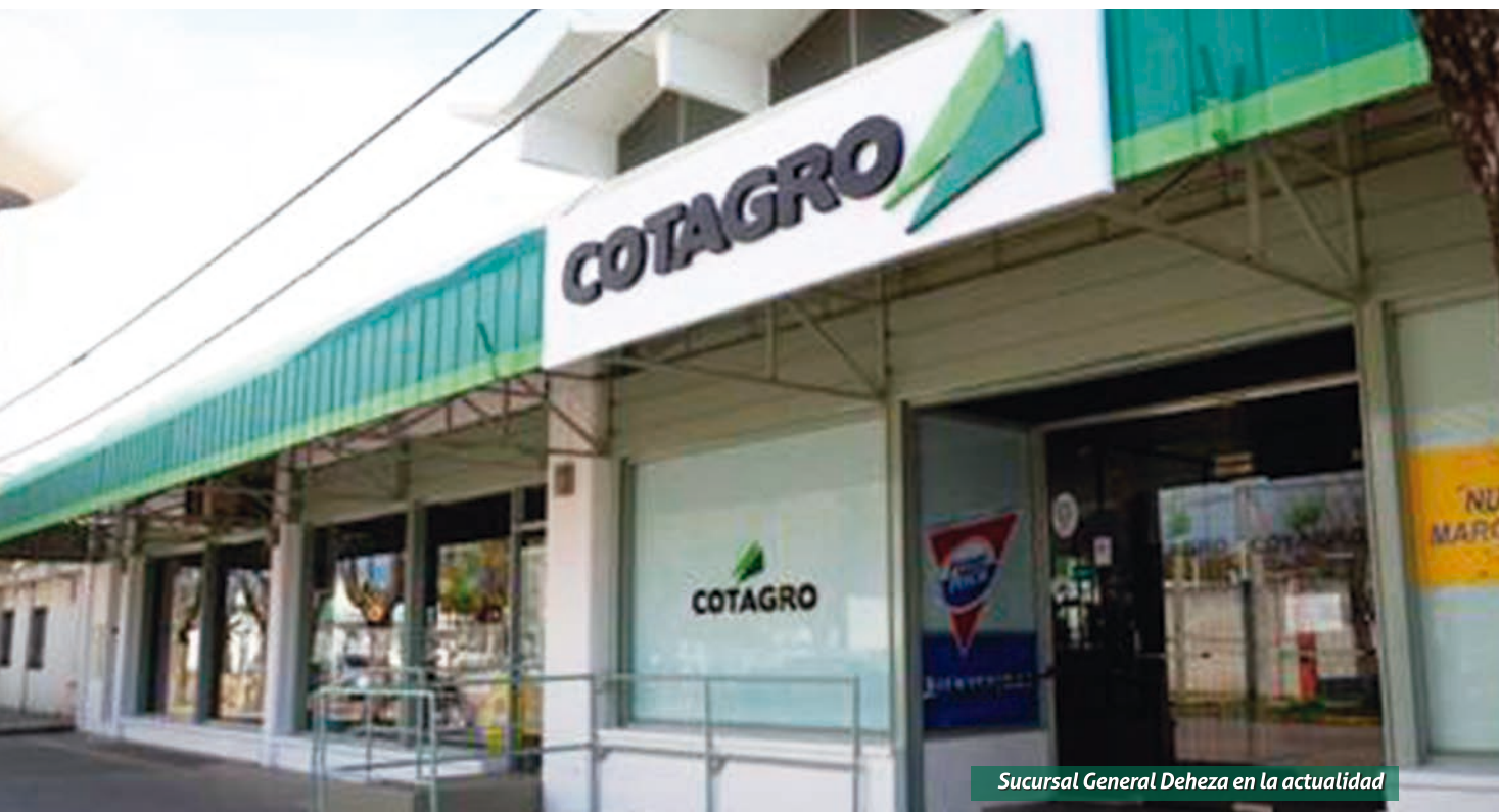
Sucursal General Deheza en la actualidad