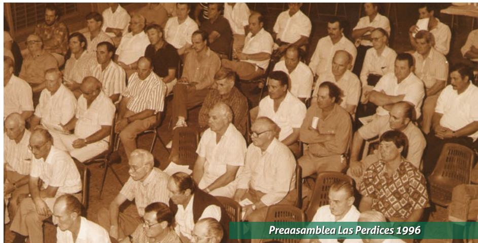
Preasamblea Las Perdices 1996