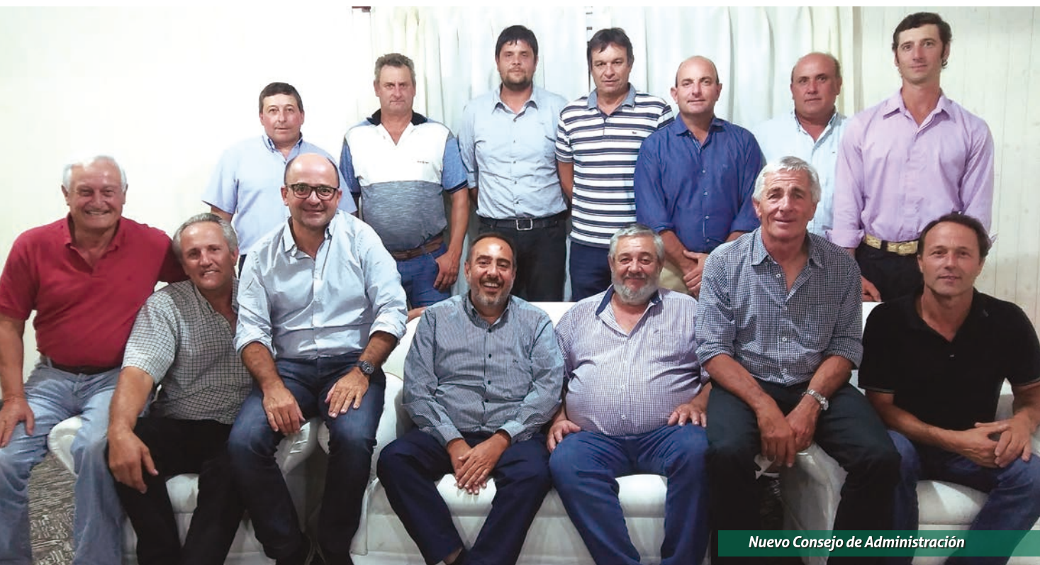
Nuevo Consejo de Administración