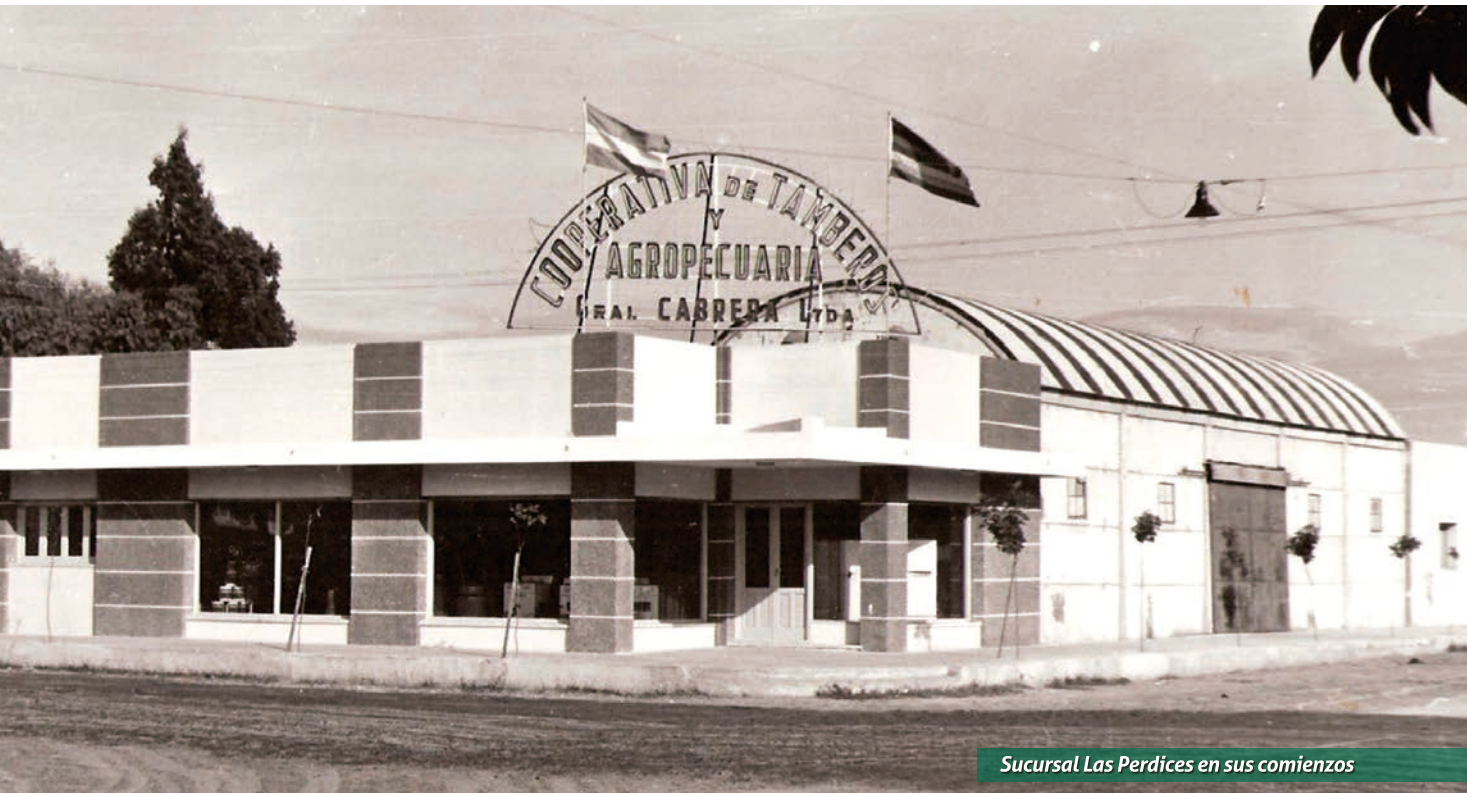
Sucursal Las Perdices en sus comienzos