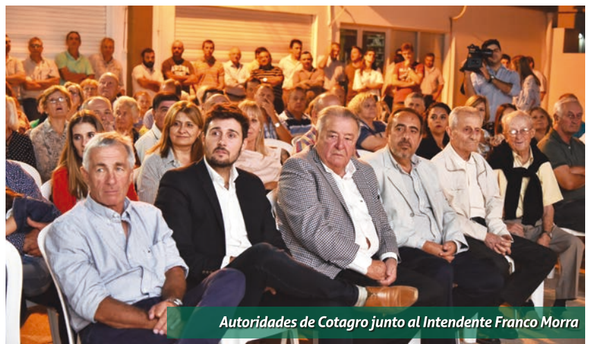
Autoridades de Cotagro junto al Intendente Franco Morra