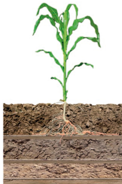
Raíces crecen hacia los costados debido a una capa de suelo compactada