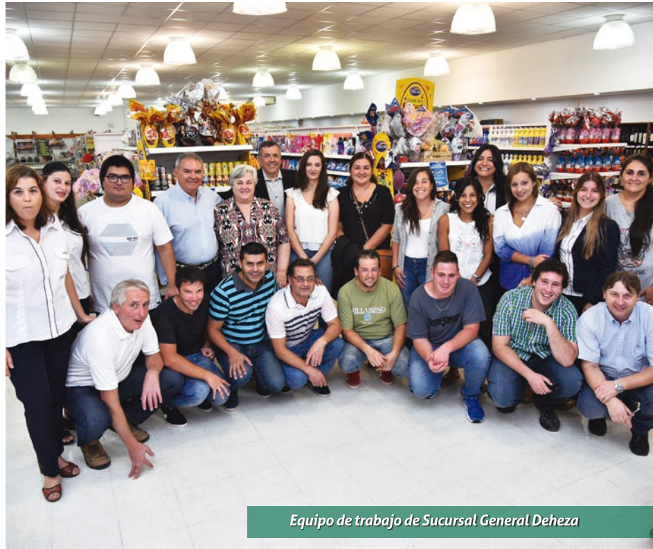
Equipo de trabajo de Sucursal General Deheza

mino de expansión que hoy permite que la Cooperativa cuente con 15 puntos de atención al asociado.