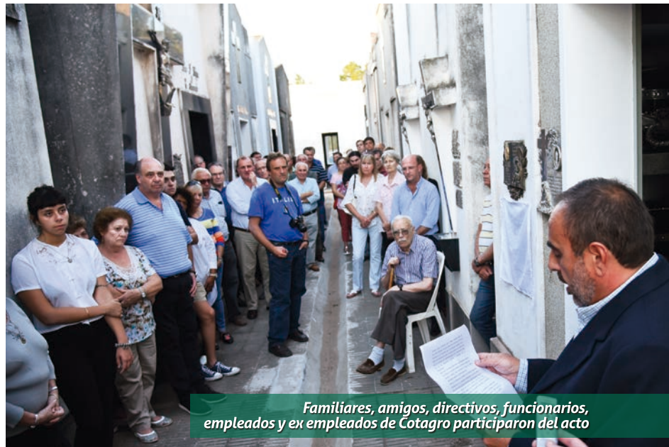
Familiares, amigos, directivos, funcionarios, empleados y ex empleados de Cotagro participaron del acto

“ El objetivo es dejar en esta placa nuestro postrero agradecimiento, nuestra eterna admiración y nuestro compromiso de seguir empeñándonos en decidir con justeza y con justicia, para que Cotagro siga perdurando por mucho tiempo, por tanto tiempo como los fundadores y él lo soñaron. ”