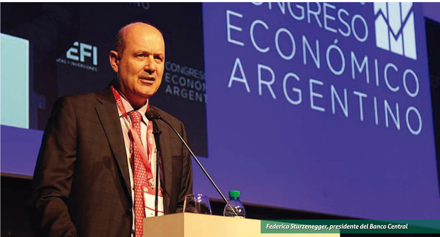
Federico Sturzenegger, presidente del Banco Central