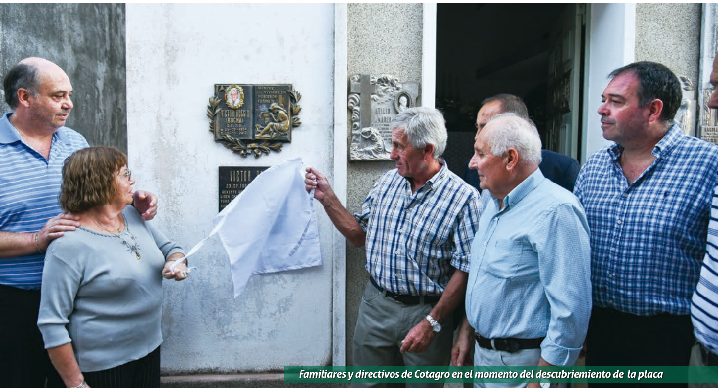
Familiares y directivos de Cotagro en el momento del descubrimiento de la placa