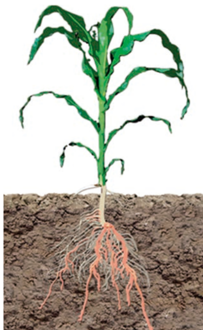
Raíces creciendo en profundidad sin impedimentos

Un suelo posee una estructura estable cuando es capaz de conservar el ordenamiento de sólidos y el espacio poroso ante la incidencia de agentes externos: acción del agua o disturbios mecánicos como las fuerzas impuestas por las herramientas, rodados de las máquinas agrícolas o pisoteo de los animales.