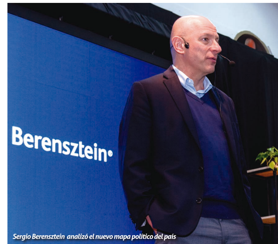
Sergio Berensztein analizó el nuevo mapa político del país