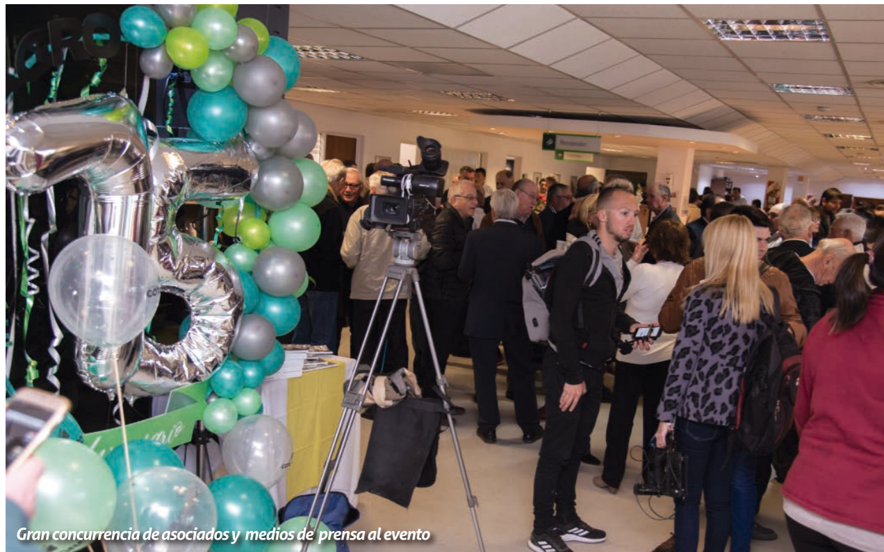
Gran concurrencia de asociados y medios de prensa al evento