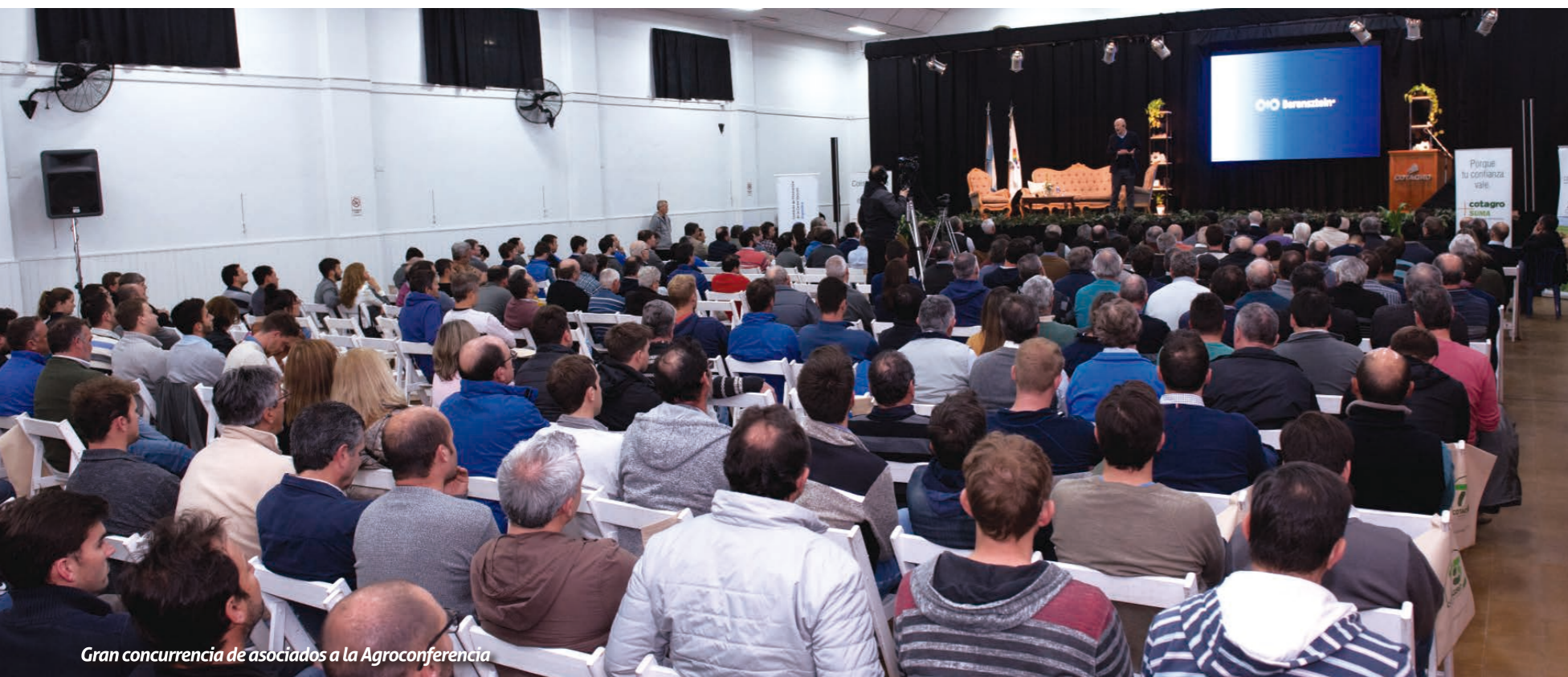
Gran concurrencia de asociados a la Agroconferencia