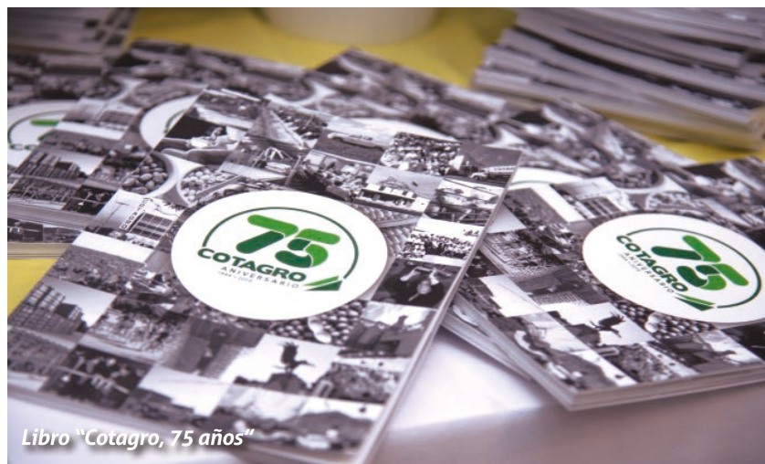
Libro "Cotagro, 75 años"