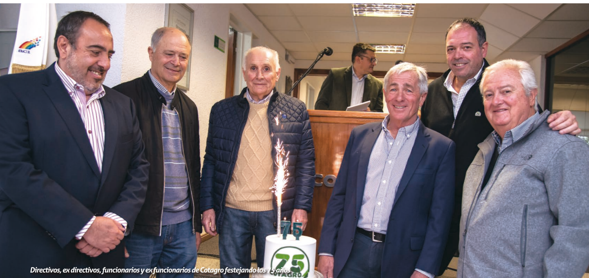
Directivos, ex directivos, funcionarios y ex funcionarios de Cotagro festejando los 75 años.