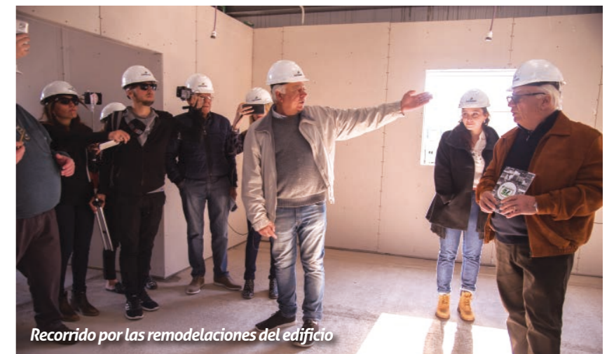
Recorrido por las remodelaciones del edificio