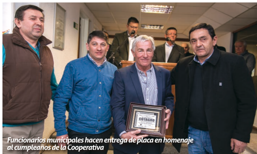
Funcionarios municipales hacen entrega de placa en homenaje al cumpleaños de la Cooperativa

Nacida como una Cooperativa de Tamberos en General Cabrera, hoy se posiciona como una de las cooperativas agropecuarias más importantes del país, líder en producción, industrialización y exportación de maní y en comercialización de productos y