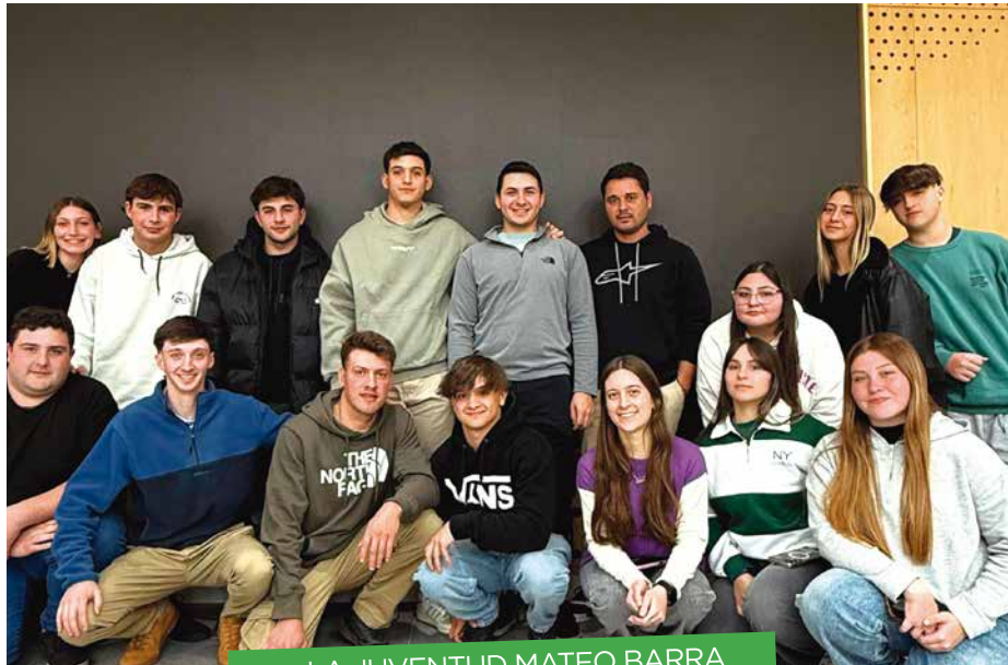
LA JUVENTUD MATEO BARRA ORGANIZÓ LA CHARLA: